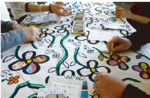
▲「つながるワークショップ」の様子。